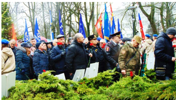
Сотрудники силовых структур