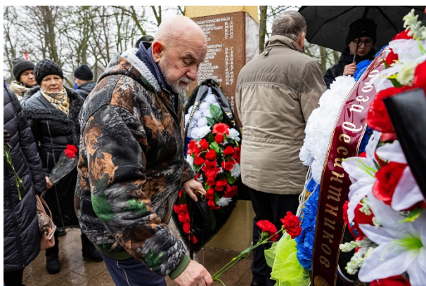
Ветеран афганской войны