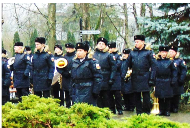
Военный оркестр играет марш