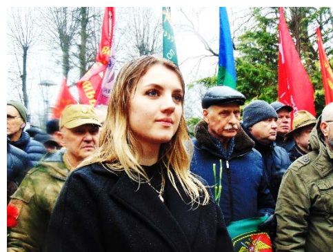
Одухотворённое лицо девушки