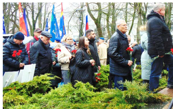
Сотрудники «Центра Молодёжи»