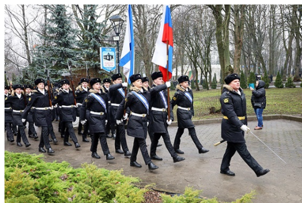
Идёт рота почётного караула