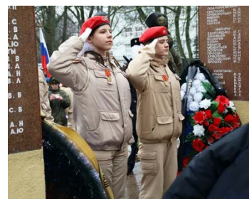
Отдают честь юнармейцы