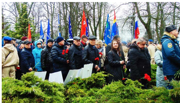
Члены областного комитета ветеранов