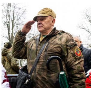
Отдаёт честь ветеран