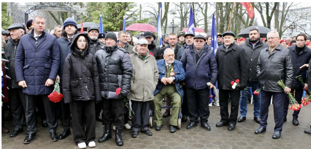
Руководство области и города, ветераны

15 февраля 2024 года в парке «Юность» у мемориала «Скорбящие родители» Калининграда состоялся торжественный митинг с участием представителей органов власти, ветеранов, военнослужащих и членов их семей.