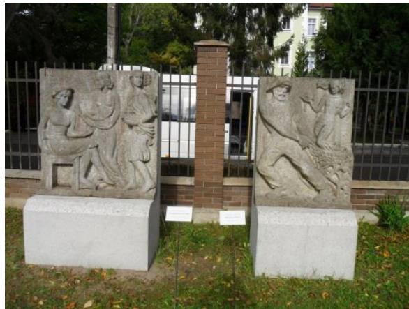
• Прекрасные барельефы