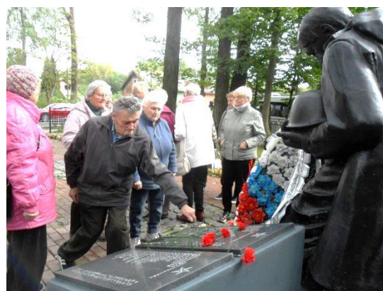
Ветераны возложили цветы