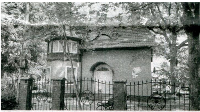
Вилла «Хельга». Сейчас корпус детского пульмонологического санатория.