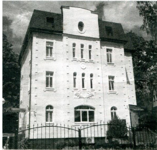
Бывшая вилла «Лесной мир» (Villa Waldfriede) на Гаузуштрассе, ныне гостиница «Георгенсвальде» на ул. Токарева, 6.

В Отрадном много красивых немецких вилл. Многие виллы назывались в честь детей немецких пенсионеров: «Мария», «Агнес», «Хелена», «Эльза», «Хельга», «Цецилия». Архитектурно-планировочные особенности этой «колонии вилл» сохранились до настоящего времени, практически все виллы сейчас восстановлены.