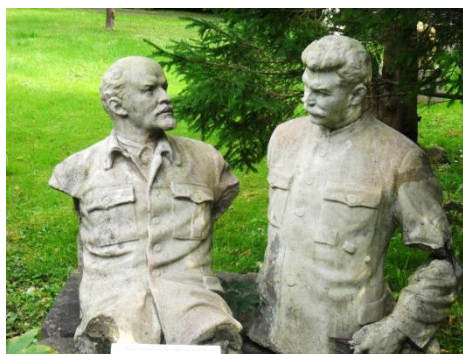
В.И. Ленин и И.В. Сталин