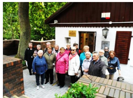
У входа в здание музея