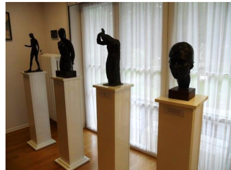
Прекрасные экспонаты старины